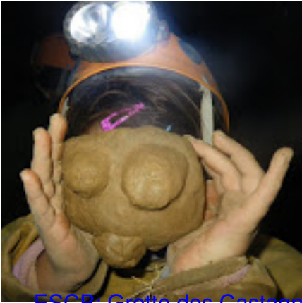
ESCB. Grotte des Castagnets - 18 Octobre 2009