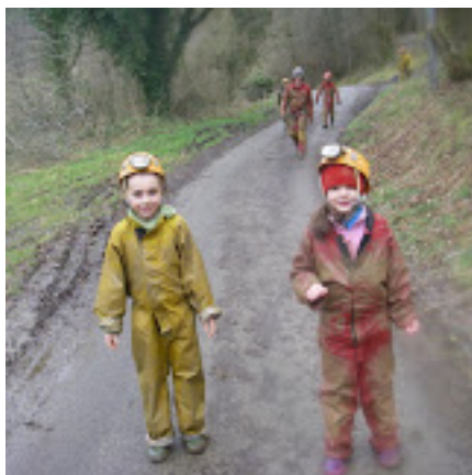
ESCB : Grotte de Capbis