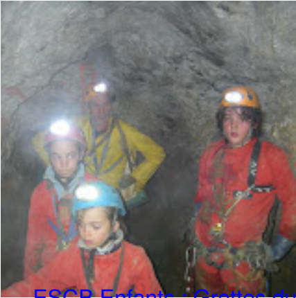
ESCB Enfants . Grottes du Roy