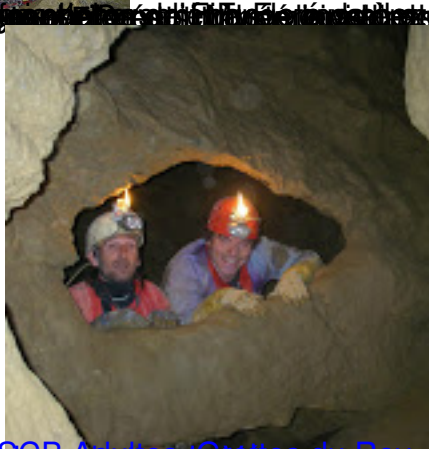
ESCB Adultes Grottes du Roy